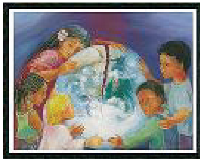
The Children Are Asking $39