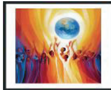
Women Singing Earth $25

¿Has visto las nuevas obras de arte en el vestíbulo? Estas obras son en honor a la diversidad cultural de nuestros hijos e hijas en Nueva Esperanza. Son reproducciones de pinturas de Sor Mary Southard de la congregación de San José. Estamos buscando a individuos y familias que deseen donar una obra de arte. Las donaciones serán bienvenidos y pueden ser dejadas en la oficina de la iglesia.