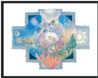
One Sacred Community $19