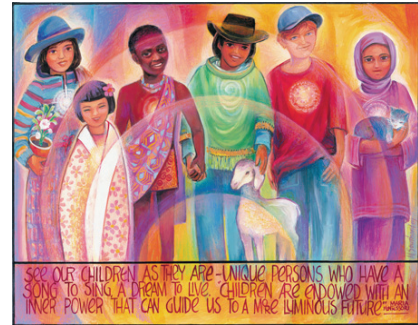
Our Unique Children $39